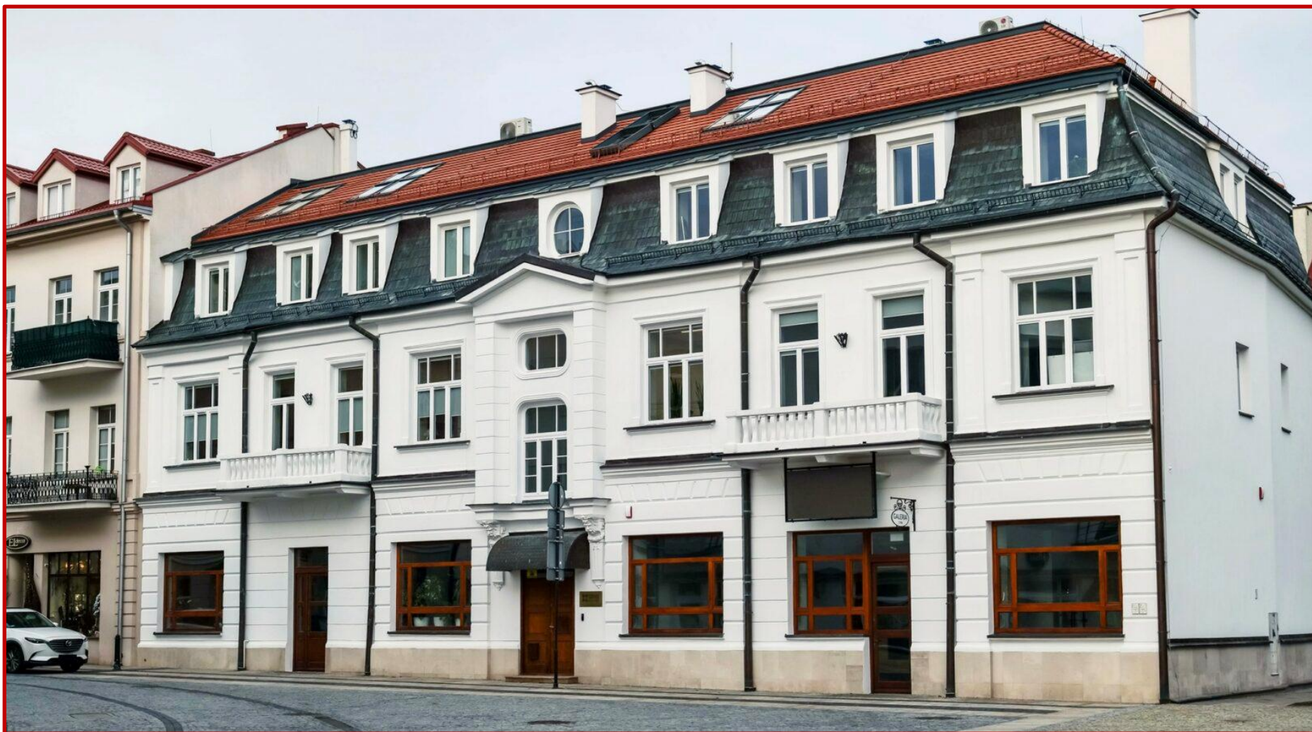
Tak wygląda budynek główny Podlaskiego Instytutu Kultury.